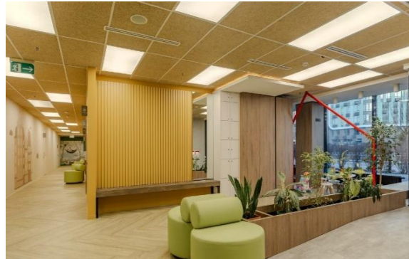
Відділення для дітей