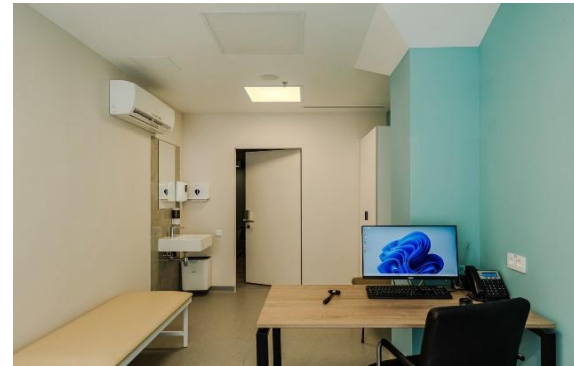
Відділ загальної практики та сімейна медицина