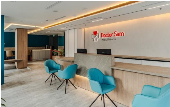
Відділення для дорослих