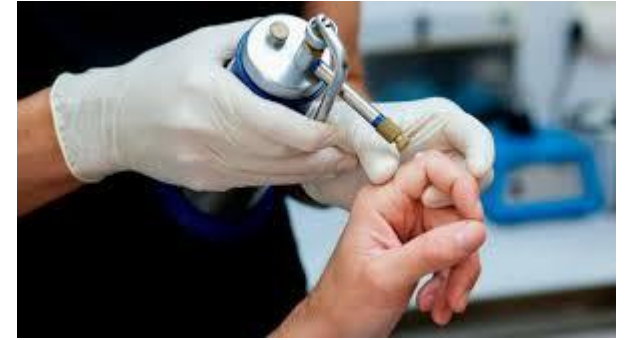
Кріодеструкція рідким азотом (видалення вірусної бородавки)