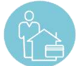
ЦВ перед третіми особами