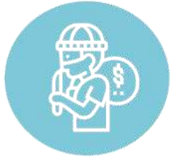
Крадіжки зі зломом, грабіж