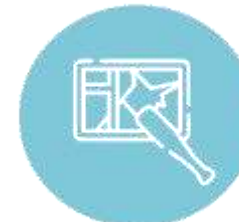
Протиправні дії третіх осіб