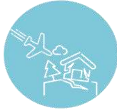
Падіння пілотованих об'єктів